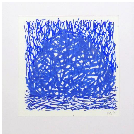
« Meule (étude en bleu) » gouache sur papier • 2013

Rendez-vous collectionneur possible le matin et le lundi au 06 71 633 633