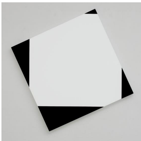
« Carré 2 (au carré) n°3 » • 2012

Cette exposition « 30 ans • persiste et signe » témoigne de l'attachement de François MORELLET à l'histoire de la galerie Oniris et à sa place singulière dans le panorama de l'art contemporain français depuis trois décennies.